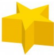
Pentagram mic Prism