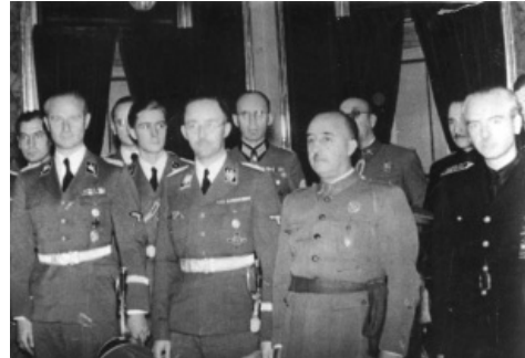
Franco en 1940 junto con Heinrich Himmler (a su derecha), uno de los hombres de confianza de Hitler. A su izquierda, con uniforme de la Falange, aparece Serrano Suñer, cuñado de Franco y figura predominante del régimen en aquel momento.