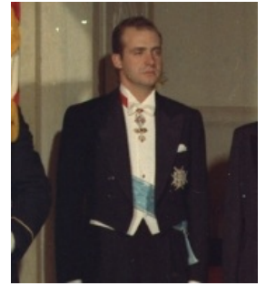
Juan Carlos I en 1971

Entre estas concesiones, en 1969 Franco nombró sucesor de la Corona a Juan Carlos de Borbón , hijo de Juan de Borbón, que por un acuerdo entre su padre y Franco se había criado junto a este último.