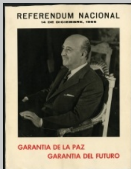
Cartel del referéndum de 1966