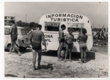
El turismo de sol y playa fue el principal gancho del boom turístico de los 60.

Otro fenómeno muy importante de este período fue el boom del turismo . España era un país barato y estable, estaba próxima a los países más ricos de Europa y dotada de abundante sol y playa . Por eso se convirtió en un destino privilegiado de millones de turistas europeos, que a su vez introdujeron en la economía española enormes cantidades de divisas .