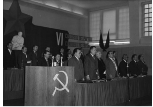
VI Congreso del PCE, celebrado en Praga (entonces Checoslovaquia) en 1960

Aparte de la oposición clandestina, la permisividad del régimen hacia el asociacionismo católico permitió que surgiera una importante oposición católica , bajo la influencia de la democracia cristiana. Su postura estaba muy próxima a la de los sectores más reformistas del régimen, pero muy lejos de su ala dura.