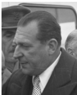
Juan de Borbón