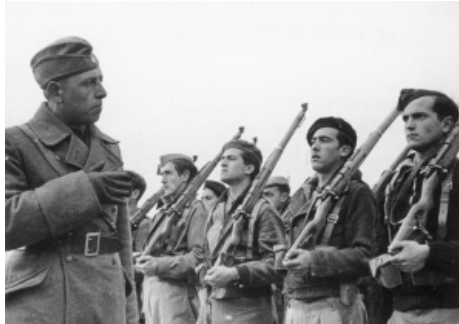
Un oficial alemán de la Legión Condor, una unidad alemana que luchó con el bando "nacional" durante la Guerra Civil, entrena a soldados de dicho bando en 1939.

España no participó oficialmente en la II Guerra Mundial, pero apoyó claramente a la Alemania nazi e incluso envió tropas de voluntarios falangistas (algunos de los cuales en realidad fueron obligados a ir) a ayudar a los alemanes en el frente ruso: se le llamó la División Azul . Por eso al concluir la II Guerra Mundial España quedó aislada internacionalmente , al ser considerada el último de los regímenes fascistas. A fin de superar el aislamiento Franco trató de maquillar el régimen para hacerlo parecer una democracia y le dio el nombre de "democracia orgánica" . Pero no convenció a nadie.