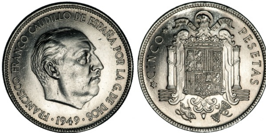
Moneda de 5 pesetas de Franco (1949)

El instinto de supervivencia del dictador le permitió conservar el poder 36 años y morir de muerte natural, no como sus antiguos aliados fascistas. A su muerte la sociedad española supo crear una nueva democracia sin necesidad de una revolución. Sería el momento de la Transición española .