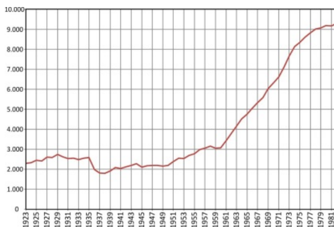
Evolución del PIB per capita 1923-1982 (en dólares de 1990).

La llegada de divisas procedentes de emigrantes y turistas , el favorable contexto económico internacional , la apertura de la economía española y sus bajos costos laborales hicieron que durante la década de los años 60 se produjera en España un extraordinario despegue económico .