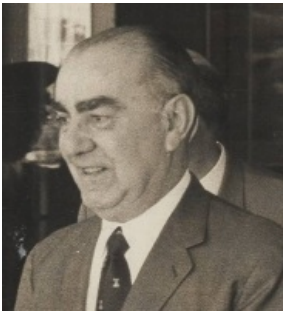
Luis Carrero Blanco

La oposición católica gozó de una mayor tolerancia por parte del régimen franquista.