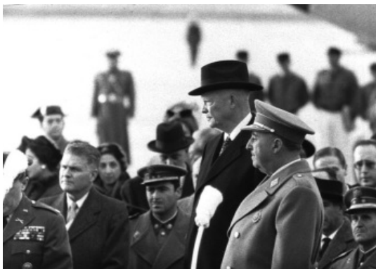
Franco junto al presidente de Estados Unidos, Dwight D. Eisenhower, durante su visita oficial a España en 1959

La segunda etapa del franquismo se inició por el fracaso de la Autarquía y por el desarrollo de la Guerra Fría . A Estados Unidos y sus aliados les importaba cada vez menos que en el pasado España hubiera apoyado a los fascismos. En cambio, les interesaba cada vez más que España podía ser un aliado muy útil contra el comunismo. 1953 fue un año muy importante para salir del aislamiento: por un lado España firmó con el Vaticano el Concordato con la Santa Sede , que mejoró sus relaciones con los católicos de otros países; por otro, firmó con Estados Unidos los Pactos de Madrid .