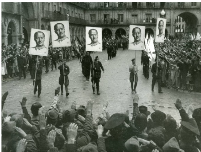
Desfile franquista en Salamanca en 1937, festejando la conquista de Gijón. El culto a la personalidad del dictador, la estética militar y los saludos romanos son elementos formales típicos de los fascismos.