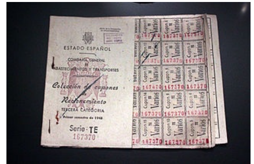
Cartilla de racionamiento de 1945

La Autarquía retrasó la apertura internacional y la recuperación de la economía española . Solo en 1955 se recuperaron los niveles más elevados de los felices años 20.