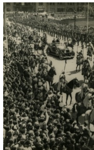
Visita de Franco a Barcelona en 1947 En las grandes puestas en escena franquistas la Guardia Mora tuvo siempre un papel destacado, como exaltación imperialista y como conmemoración de la victoria franquista en la Guerra Civil.

Pero más allá de estos principios ideológicos básicos, el franquismo siempre mostró cierta capacidad de adaptarse a las circunstancias . En realidad, el franquismo se apoyaba en distintos grupos políticos, que se habían unido sólo por su rechazo a la II República y a la izquierda. Había cuatro grandes "familias políticas" dentro del régimen franquista: