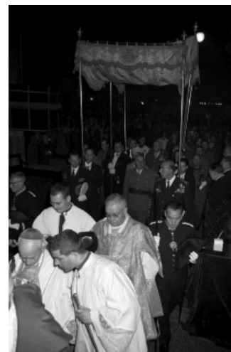
Franco entra bajo palio en la Catedral de Gerona (1960)

f) Influencia fascista. El régimen franquista surgió cuando los fascismos estaban en auge. Para atraerse la ayuda de los países fascistas y aprovechar la capacidad de movilización y de control político que tenían estos movimientos, el régimen franquista adoptó características formales propias del fascismo: creación de un partido único (el "Movimiento Nacional", cuyo núcleo era la "Falange Española Tradicionalista y de las JONS"), un sindicato único dirigido por el Estado (a esta práctica se llama sindicalismo vertical), actos públicos de masas, símbolos tomados de la Falange, como el saludo fascista, la camisa azul, el yugo y las flechas, etc.