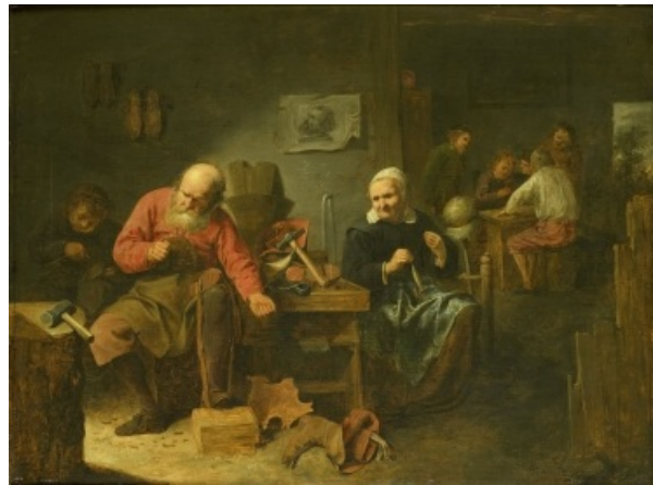
Taller de un zapatero. Cuadro de David Rijckaert (1640-1660)