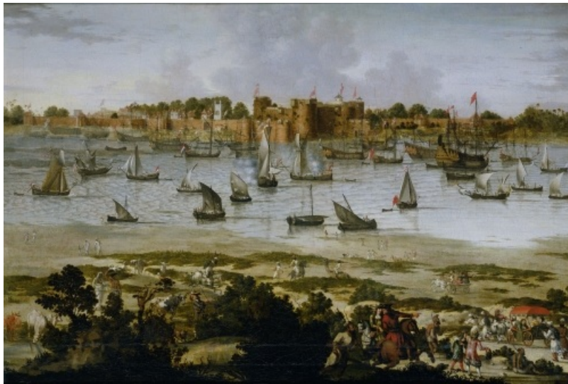
Barcos europeos en el puerto colonial de Surat (India). Pintura anónima (aprox. 1670)