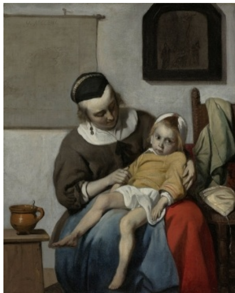
El niño enfermo. Cuadro de G. Metsu (1664-1666)

En realidad, nacían muchos niños , ya que no había control de la natalidad y que la gente necesitaba tener hijos para asegurar su subsistencia en la vejez. Pero también morían muchos niños en su primer año de vida , así como muchas madres como consecuencia de los numerosos partos. En general, la mala alimentación, el atraso de la medicina, la falta de higiene y los efectos de las guerras hacían que la esperanza media de vida fuera muy baja (o sea, que la gente no podía contar con vivir tantos años de media como ahora).