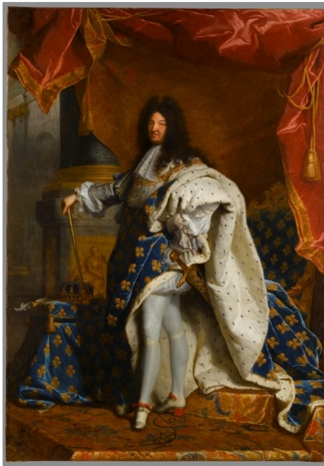
Retrato de Luis XIV por H. Rigaud (1701).

El reinado de Luis XIV, llamado el Rey Sol , es el modelo de monarquía absolutista de derecho divino. Mira cómo la forma en que se presenta el rey (capa de armiño con el emblema de su dinastía, corona y cetro, peluca...) trata de marcar una gran distancia entre el rey y una persona corriente. Porque, ¿cómo podría una persona corriente ser el rey absoluto de millones de súbditos?