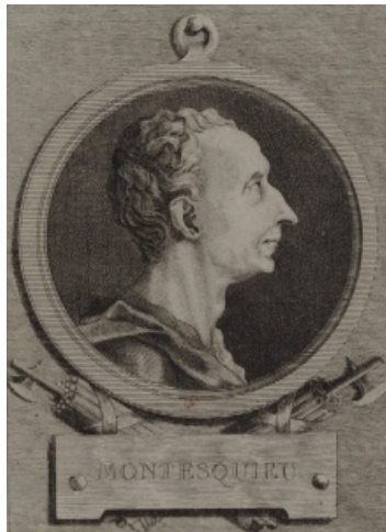
C.L. de Secondat, barón de Montesquieu (1689-1755)