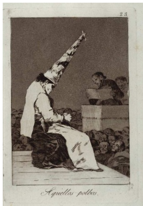
Francisco de Goya, Los Caprichos , p. 23 (1799)

5) Para finalizar, la cultura era teocéntrica , es decir, giraba en torno a la idea de Dios y a los mandatos de la religión. La cultura escrita estaba al alcance sólo de una minoría, mientras que la mayoría era analfabeta .