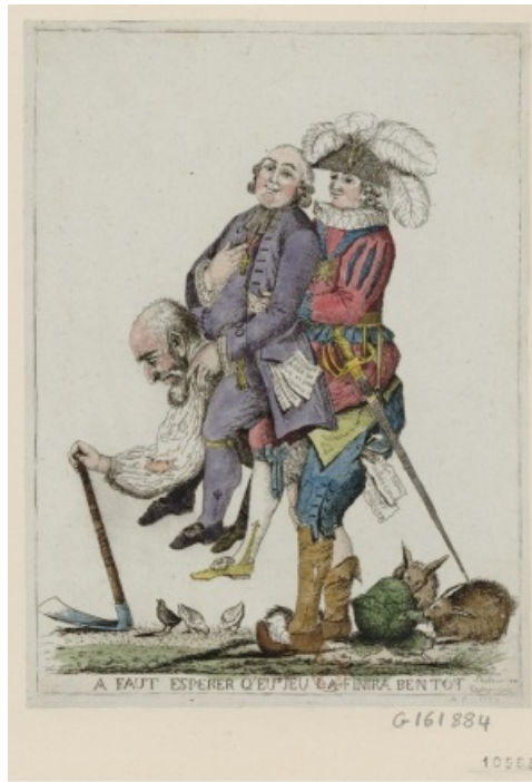
Caricatura francesa sobre los tres estamentos (1789) El Tercer Estado (abajo) tiene que cargar con los impuestos y privilegios de la Iglesia (delante) y la nobleza (detrás)

La mayoría de la población, desde los banqueros y comerciantes más ricos hasta el más pobre de los mendigos, formaba el Tercer Estado , es decir, el estamento de los no privilegiados .