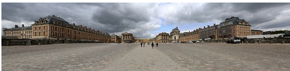
Palacio de Versailles, la corte de la monarquía absoluta francesa

El mundo contemporáneo nació rompiendo con el mundo anterior, al que llamamos " Antiguo Régimen ". Así que tendremos que empezar describiendo ese punto de partida y viendo cómo se produjo la ruptura.