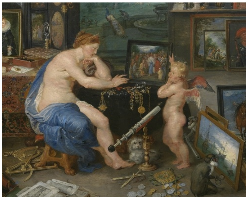
Jan Brueghel y Pedro Pablo Rubens, La vista (1617) En este detalle del cuadro podemos ver representado, entre otras invenciones de la Revolución científica (por ejemplo, las gafas del mono), un telescopio.

Si miras el texto, verás que Galileo no afirma haber inventado el telescopio (fíjate, lo dice en el primer párrafo). Pero sí fue el primero que consiguió fabricar y vender telescopios realmente eficaces, dando un gran impulso a la tecnología. El telescopio de Galileo tuvo su gran presentación pública en 1611. Si quieres hacerte una idea del eco que tuvo la noticia, mira este cuadro que se pintó solo seis años después.