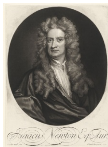
Isaac Newton (1643-1727), padre de la Física moderna, es uno de los máximos representantes de la Revolución científica.

Por otra parte, la necesidad de medir con precisión dio un gran impulso a las matemáticas como lenguaje de la Ciencia .