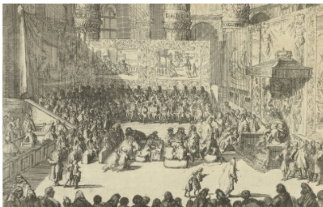
Guillermo III se presenta como Rey de Inglaterra ante el Parlamento (1689) (detalle). Fue él quien aprobó la carta de derechos (Bill of Rights) que convirtió a Inglaterra en una monarquía parlamentaria.

Durante la Revolución Inglesa autores como John Locke plantearon algunos de los principios fundamentales de lo que acabó siendo el liberalismo , base de nuestro actual sistema político.