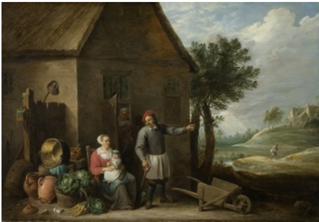
Campesinos a la puerta de su granja. Cuadro de David Teniers (1640-1670)

Aún no existía la industria. La actividad artesanal o manufacturera estaba en general controlada por los gremios .