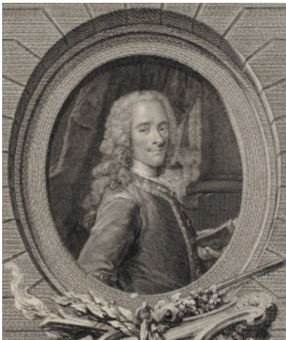
F.M. Arouet, apodado Voltaire (1694-1778)

Pero, sobre todo, la Ilustración puso de manifiesto la necesidad de liberar a la Razón de cualquier autoridad política o religiosa, defendiendo una cultura laica , es decir, independiente de la religión, y la libertad de expresión . Sobre ese valor central de libertad , los autores ilustrados, como Voltaire , Montesquieu o Rousseau , desarrollaron las ideas políticas nacidas en la Revolución Inglesa. Esas ideas influyeron en el Antiguo Régimen, creando una nueva forma más suave de absolutismo, el despotismo ilustrado .