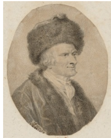
Jean-Jacques Rousseau (1712-1778) Dominio público