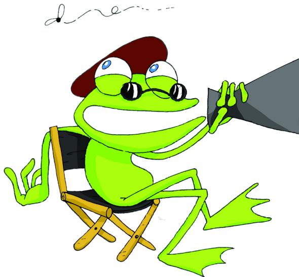
Imagen de Al berto Arribas Merino en Banco de recursos INTEF con licencia CC