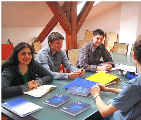
Imagen de CEJISS en Wikimedia de dominio público

Observa estas expresiones. ¿Cuál resultaría inadecuada en una entrevista de trabajo?