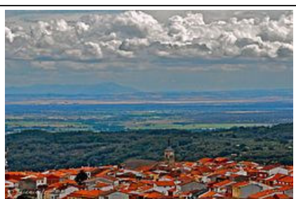
Imagen en Wikimedia Commons de Pasaminutoa. Licencia CC