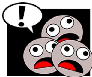
Imagen en Pixabay de OpenClipart-Vectors bajo licencia CC0 Public Domain

Antes de comenzar a expresar nuestras opiniones, sería bueno recordar un poco las diferentes modalidades oracionales y cómo construirlas.