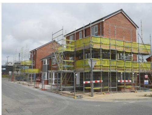
Viviendas en construcción en Liverpool (Inglaterra), 2013

Aumenta la demanda de vestido. Hará falta más suelo para cultivar plantas textiles, y más petróleo, que entre otras cosas sirve para fabricar fibras sintéticas.