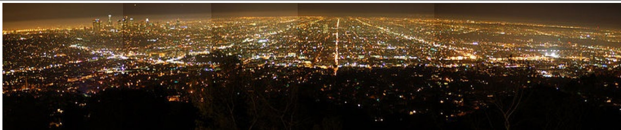
La ciudad de Los Ángeles, de noche (Estados Unidos de Norteamérica)