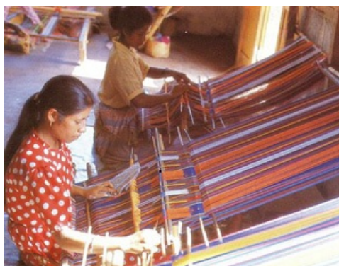
Taller textil en Timor Este (Indonesia, Asia)

Aumenta la necesidad de alimentos. Por ello, habrá que dedicar más tierra a la agricultura, y esta actividad económica requiere agua.