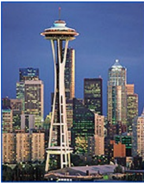
Space Needle ("Agua espacial"), torre situada en Seattle (Estados Unidos)

Se necesita más agua potable , que no es un recurso que sobre en el m