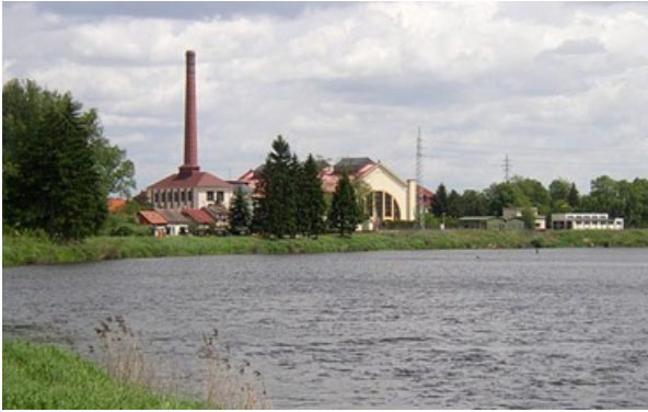
Planta de tratamiento de agua a orillas del río Elba, República Checa