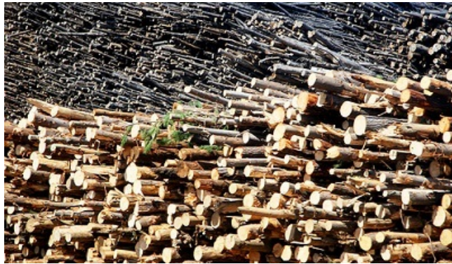
Recursos madereros en Complejo Forestal Industrial Horcones, Arauco, Chile