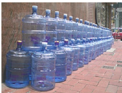
Botellas de agua mineral