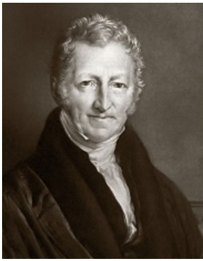
Thomas Robert Malthus (1766 - 1834)

Imagen de Liberal Freemason de dominio público