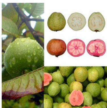
Fruto del guayabo, árbol tropical