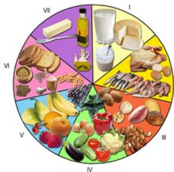
Rueda de los alimentos

era de 2.360 por persona y día, mientras que hoy esa cifra se ha elevado a 2.740 calorías. Según los expertos, son necesarias unas 2.400 calorías/día. Pero estos cálculos son estimaciones medias, y no debemos olvidar que gran parte de la población mundial consume menos de 2.000 calorías/día.