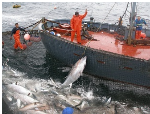
Recursos marinos: pesca de atunes en la almadraba de Tarifa (Cádiz)