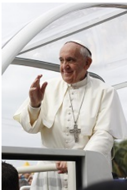
El Papa Francisco en Río de Janeiro (Brasil), julio de 2013