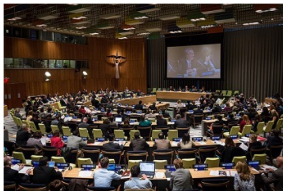
Reunión durante la celebración de la Asamblea General de la ONU, septiembre de 2013

Una tercera postura ante el problema del crecimiento de la población es la pronatalista , que defiende que el crecimiento de la población es beneficioso para el desarrollo económico y para el mundo. En esta línea se sitúan la Iglesia Católica, el Islam y otras muchas religiones.