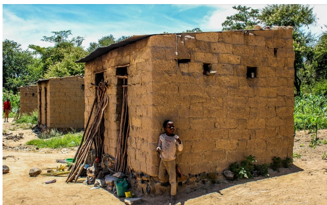
Casa pobre en Mozambique

El año 2015 un 0,7% de la población mundial (34 millones de personas) tenía el 45% de la riqueza mientras que un 74% (3.386 millones de personas) sólo poseían el 3% de la riqueza del planeta. Esta situación refleja un proceso que va en aumento y lastra la lucha contra la pobreza en el mundo. Por continentes norteamérica y Europa que representan la sexta parte de la población mundial detentan casi dos tercios de toda la riqueza del mundo. Estas cifras de desigualdad extrema en el reparto de la riqueza coinciden en gran parte con el comportamiento demográfico. Frente a un mundo rico, envejecido y con baja natalidad, un mundo cada vez más pobre en recursos con tasas de natalidad muy altas. El resultado es un aumento de los desequilibrios a nivel global.