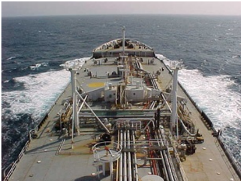
Barco petrolero SS Fredericksburg (Navegó entre 1958 y 2004)