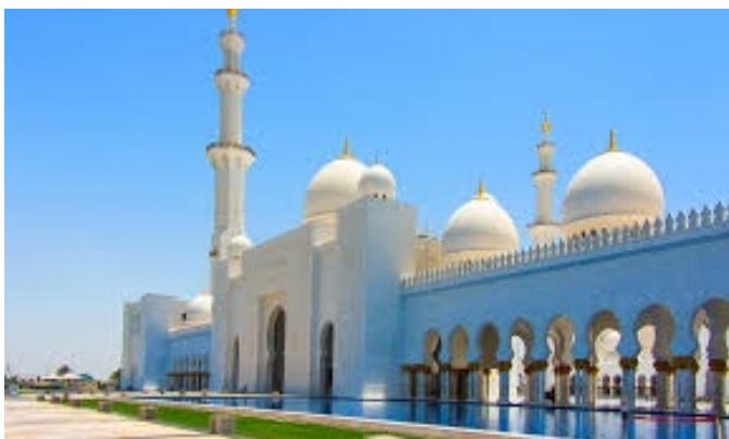
Mezquita de un jeque árabe en Dubai