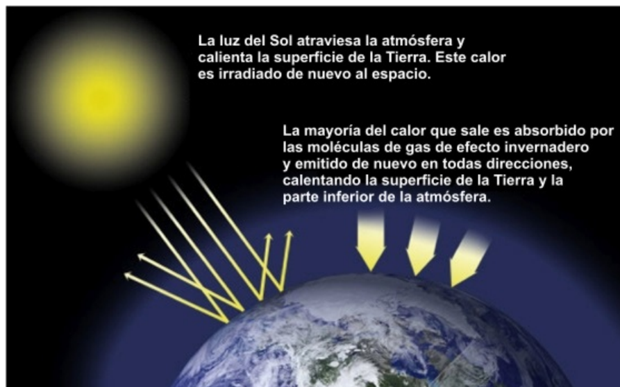
Esquema del efecto invernadero

El efecto invernadero consiste en que la atmósfera retiene parte de la radiación solar que la Tierra refleja. El resultado es un calentamiento de la atmósfera. Dentro de ciertos márgenes es un efecto natural y gracias a él la temperatura de la Tierra es adecuada para los seres vivos. El problema es que el aumento de la emisión de gases con efecto invernadero ha hecho que la atmósfera retenga demasiado calor.