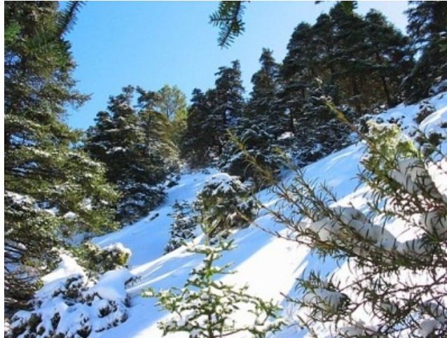
La riqueza geológica y botánica del Parque Natural de la Sierra de las Nieves (Málaga) justifica que se haya propuesto como tercer Parque Nacional andaluz. Los raros bosques de pinsapo son uno de sus mayores valores.

Para conocer qué espacios protegidos hay en tu provincia puedes empezar echándole un vistazo a este mapa de los espacios naturales andaluces . Pero para buscar información más detallada el sitio adecuado es la página web de la Red de Espacios Naturales Protegidos de Andalucía . A partir de ahí, podrás buscar toda la información complementaria que necesites recurriendo a los buscadores de internet o a libros o guías que puedas tener en casa.