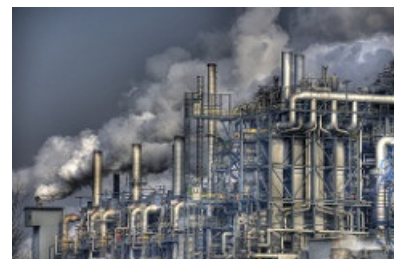
Contaminación atmosférica en Austria

Imagen en Flickr de Juergen Uch. Licencia CC BY-NC-ND 2.0