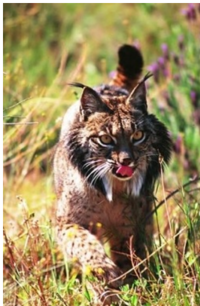
La conservación del lince ibérico, una especie endémica de nuestra península y en peligro de extinción, es uno de los factores que explica la existencia del

(...y no recurras al corta y pega : escribe con tus palabras, que si no no sirve de nada)