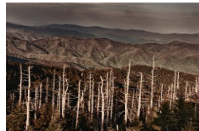
Árboles muertos por lluvia ácida en el Parque Nacional de Great Smokey Mountains (EEUU)

Imagen en Flickr de The Shared Experience. Licencia CC BY-NC-ND 2.0