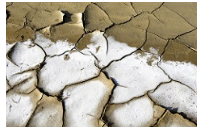
Desertificación en Timor Oriental