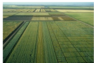
Campos de trigo en México La ocupación de grandes extensiones de tierra por unas pocas especies destinadas al consumo ha contribuido a reducir la biodiversidad.