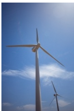
Molino eólico

Pero lograr un equilibrio entre nuestro consumo, nuestros desechos y las posibilidades del medio natural requiere también que adoptemos hábitos de consumo más responsables y sostenibles . Piensa que solo con reducir a escala mundial el desperdicio de comida que llega a la basura sin consumir podríamos aumentar significativamente la disponibilidad global de alimentos.