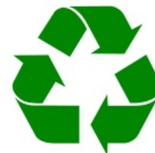
Símbolo del reciclaje

Para ello es preciso hacer un uso más eficiente de los recursos (agua, materias primas, fuentes de energía...), fomentando el desarrollo de tecnologías y procesos industriales más eficientes. Aparte de reducir el consumo de recursos, es necesario limitar los desechos : reducir los vertidos y sanear mejor los residuos. El aumento del reciclaje es esencial, porque permite a la vez reducir el consumo de recursos y la producción de desechos.