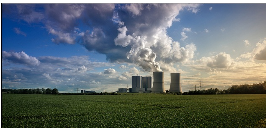
Paisaje industrial en Sajonia (Alemania)

El ser humano ha sabido adaptarse con éxito a casi todas las condiciones medioambientales. Y ha logrado controlar y modificar el medio ambiente de una forma que ninguna otra especie ha conseguido. Pero el éxito de la humanidad ha creado también grandes problemas que pueden amenazar nuestro futuro y el del planeta. Somos el problema y necesitamos ser también la solución.