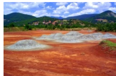
Suelo contaminado por la minería en Kosovo