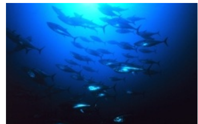
El atún rojo es una de las muchas especies marinas amenazadas por la pesca excesiva.