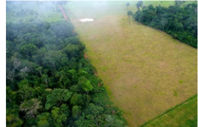
Deforestación en el Amazonas (Brasil) Imagen en Flickr de CIFOR. Licencia CC BY-NC 2.0