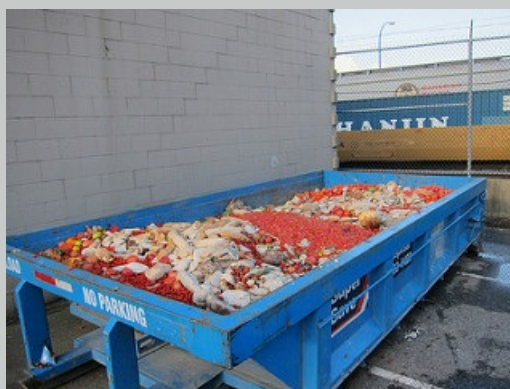
Contenedor con alimentos desperdiciados Imagen en Flickr de Stephen Rees. Licencia CC BY NC-ND 2.0

Si quieres saber más sobre este problema, sus consecuencias y sus posibles soluciones puedes empezar por este documento de la FAO sobre la pérdida y desperdicio de alimentos .