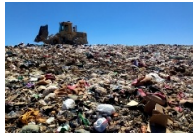
Vertedero en EEUU

Imagen en Flickr de A. Levine. Licencia CC BY 2.0