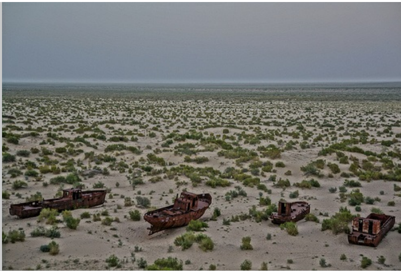
Barcos encallados en lo que una vez fue el mar de Aral