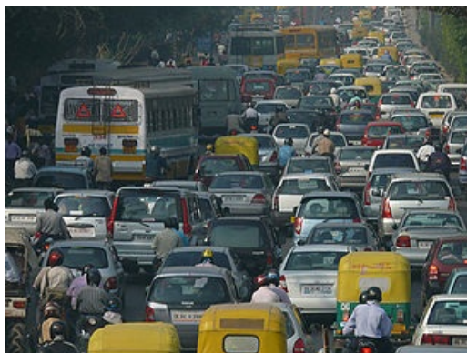
Atasco de tráfico en Delhi (India)

Se promueven también ayudas fiscales y económicas a las prácticas que contribuyan al desarrollo sostenible.