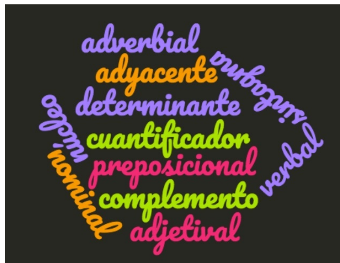
Imagen de creación propia

Pero dejémosnos de ver el significado de otros idiomas y centrémonos en el español. Veamos los grupos de palabras que se pueden formar en nuestra lengua.