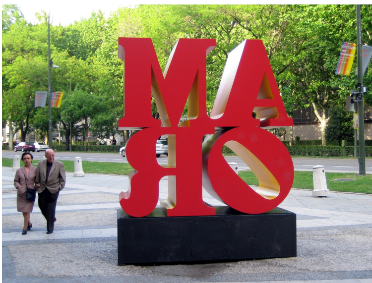
Imagen en Banco de Recursos INTEF con licencia CC

Os doy mi "palabra" de que en este tema vais a aprender un montón de cosas de las palabras. ¡Empezamos!