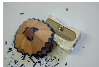
Imagen de Eugenia Bermejo en Banco de Recursos