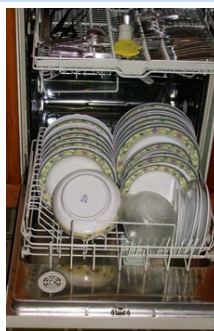
Imagen en Banco de Recursos