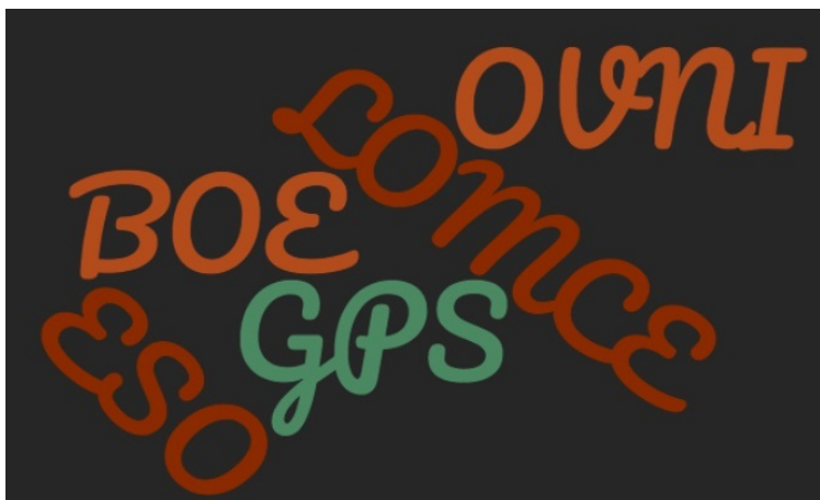
Imagen de creación propia

Es importante que sepas que no se recomienda poner puntos entre sus letras, aunque antiguamente se hacía.