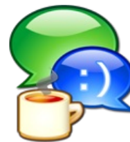
Imagen de Martorell

Cuando hablamos con otras personas sobre muchos temas, sobre todo de aquellos que nos interesan, como las cosas que hacemos en nuestro tiempo libre y de ocio, solemos exponer aquello que conocemos del tema y también expresamos lo que nos parece, nuestras opiniones al respecto. Entonces es cuando debatimos con los demás.