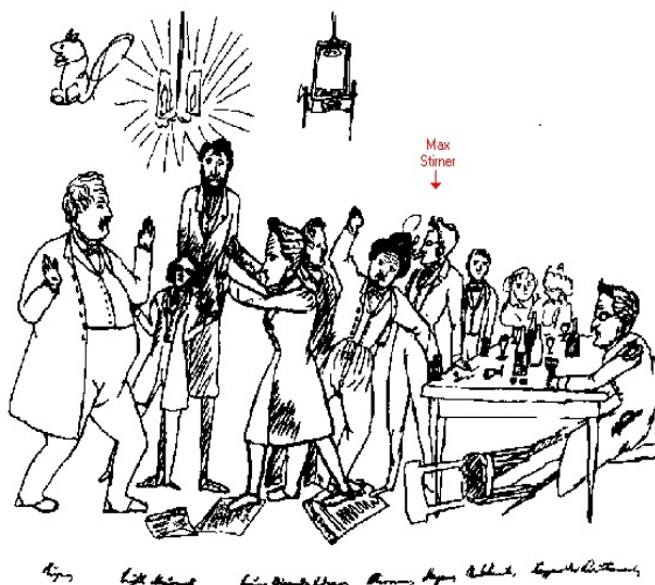
Imagen de Friedrich Engels

En este tipo de debates no se suelen respetar las reglas básicas y acaban convirtiéndose en una sucesión de acusaciones con interrupciones continuas que impiden comprender el mensaje.