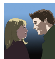
Imagen en Banco de imágenes INTEF