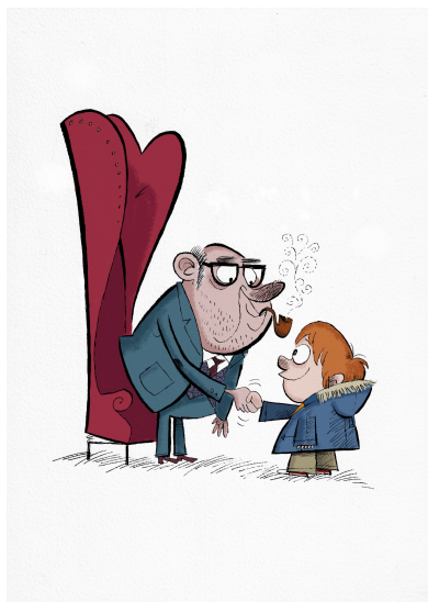
Imagen de Loren en Banco de recursos INTEF con