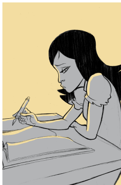
Imagen de Abraham Pérez Pérez en

El comentario crítico de un texto consiste en la valoración de las ideas que aparecen en dicho texto, mostrando nuestro acuerdo o desacuerdo con ellas de forma razonada.