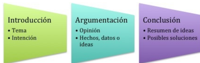
Esquema de elaboración propia