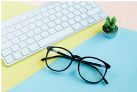
Brille, Tastatur und Kaktus-Kerze vor buntem Hintergrund