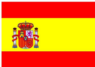
Felicitades España! Spanienflagge, flag of Spain