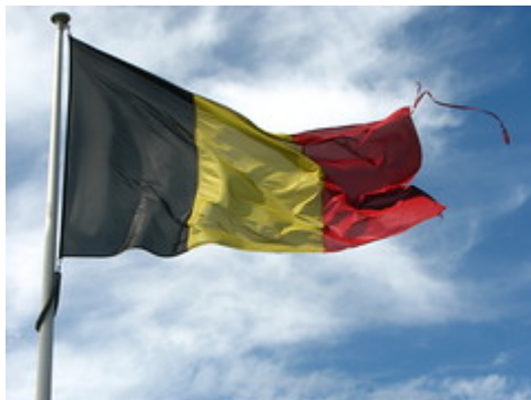
Old Frayed Belgian Flag