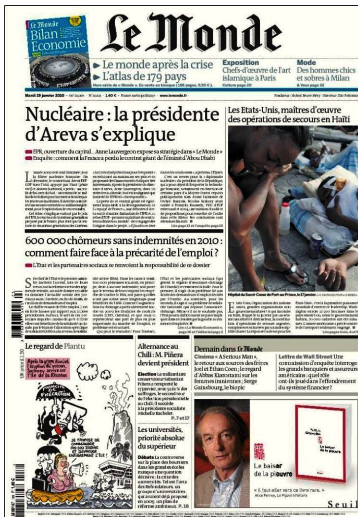
Imagen de elaboración propia

Observa la portada de este periódico y responde a las preguntas: