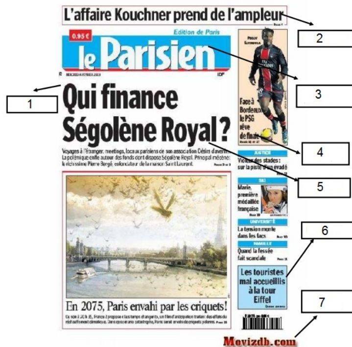
Imagen de elaboración propia

5. Escribe el nombre de las partes de la portada que aparecen numeradas en la imagen.