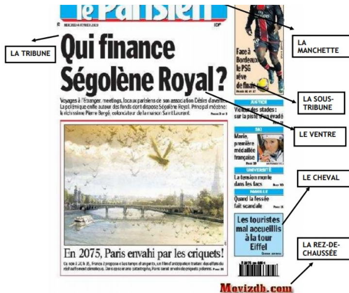
Imagen de elaboración propia