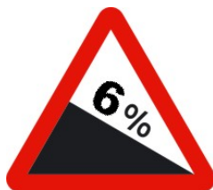
Señal de tráfico