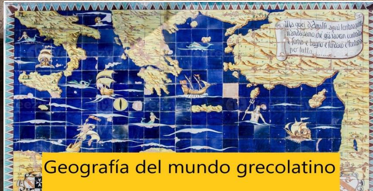
Geografía del mundo grecolatino