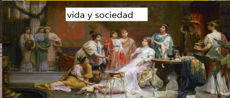
vida y sociedad