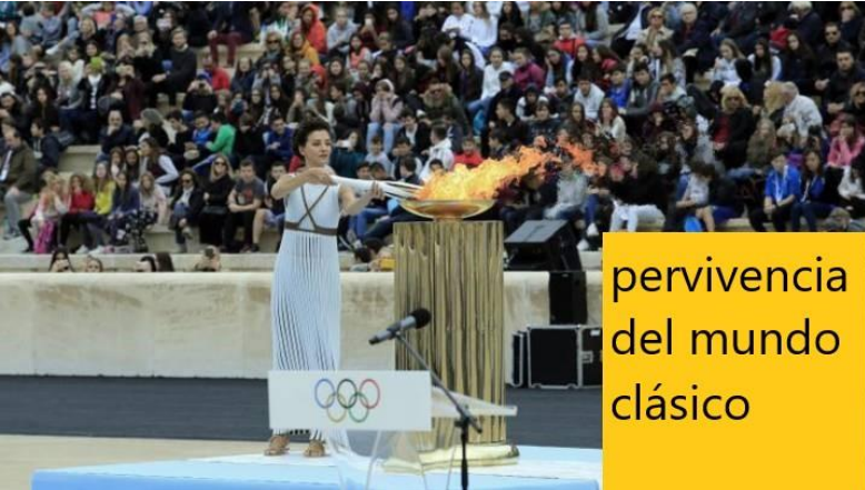
pervivencia del mundo clásico